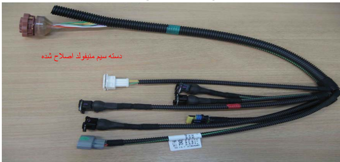
دسته سیم منیفولد اصلاح شده

(ADAPTATION VALUE) توسط دستگاه IKCO DIAG ریست شده(در منوی ECU بنزین زمینس، گزینه others) و پارامتر مربوط به زاویه دریچه گاز بررسی شود در حالت IDEL باید صفر باشد در صورت صفر نبودن، دسته سیم منیفولد با دسته سیم اصلاح شده به شماره فنی 10027008 جایگزین گردد.