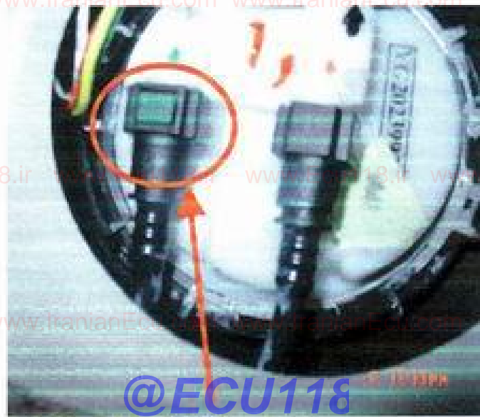
مونتاژ نادرست کانکتور

به اطلاع کلیه نمایندگیهای مجاز می رساند، در صورت مراجعه خودروهای پژو ۴۰۵، پارس و سمند، با سیستم پمپ بنزین داخل باک (Intank) و در صورت نیاز به تعویض مجموعه درجه داخل باک این خودروها حتماً دقت شود دگمه های فشاری روی کوئیک کانکتورهای متصل به درجه داخل باک به سمت طرفین (و نه به سمت بالا و پایین) قرار گیرند. قرار گرفتن دگمه های فشاری در سمت بالا و پایین، باعث فشار آوردن صندلی روی دگمه ها و بیرون آمدن شیلنگ از جای خود می شود. به تصاویر ذیل توجه شود: