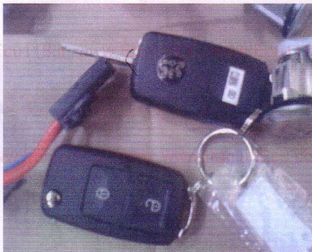
ریموت تاشو (JACK KNIFE) بدون تگ