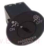
کلید غیر فعال سازی کیسه هوای مسافر