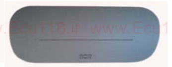
مجموعه کیسه هوای مسافر