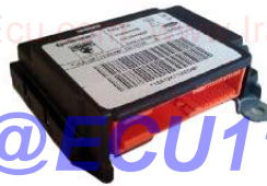
واحد کنترل الکترونیکی