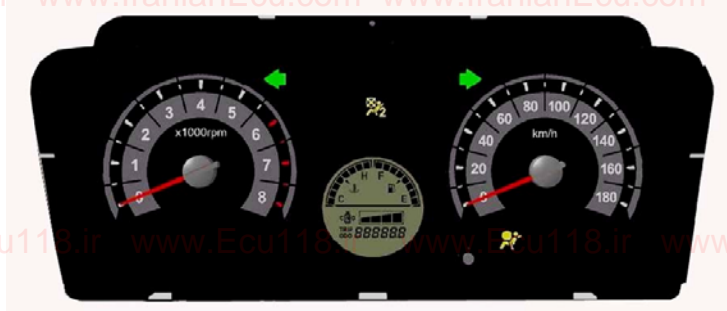
چراغهای هشدار دهنده