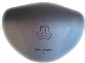
مجموعه کیسه هوای راننده