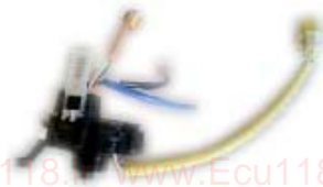
رابط چرخشی پشت فرمان