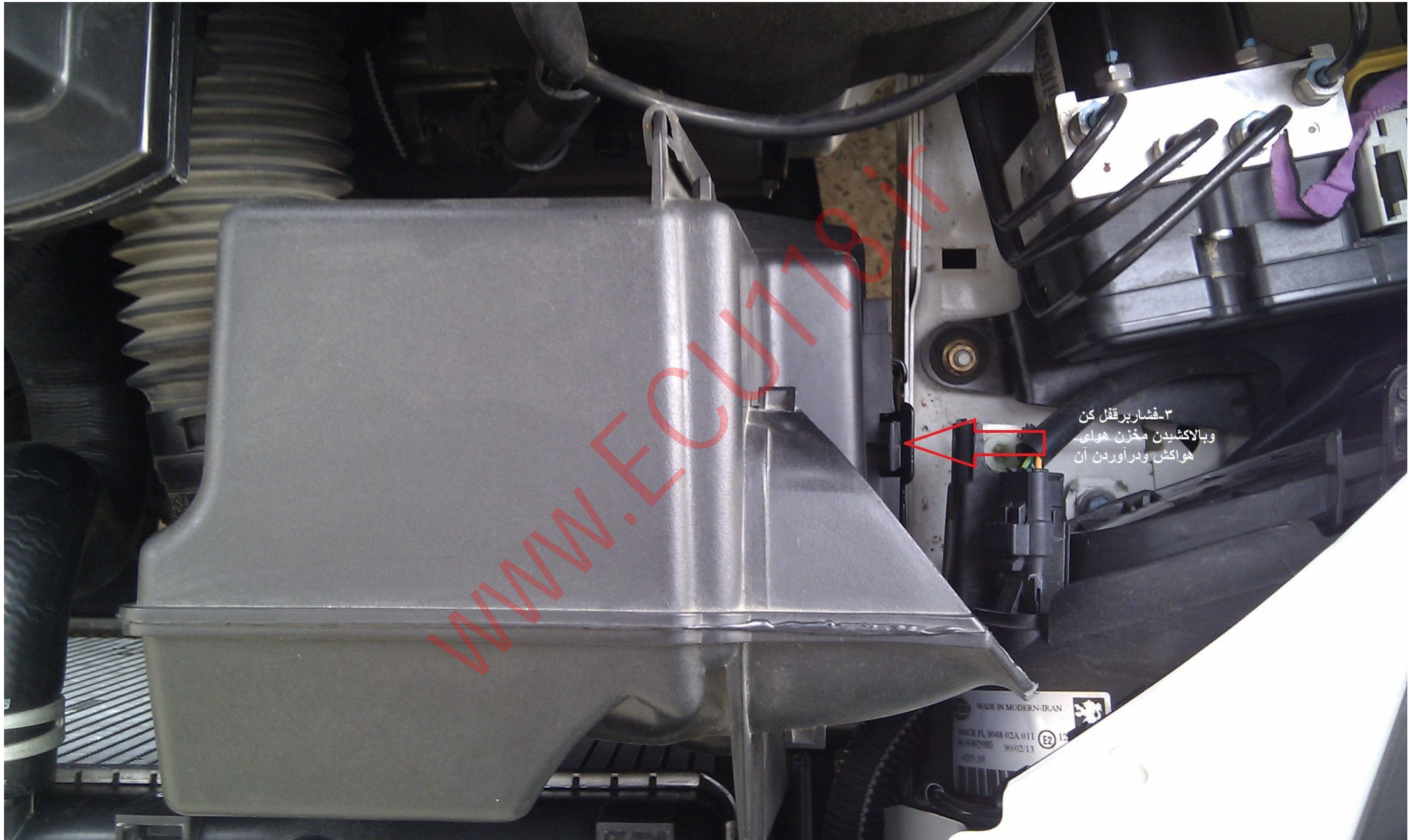
۳- فشار بر قفل کن و بلاکشیدن مخزن هوای هواکش و درآوردن آن